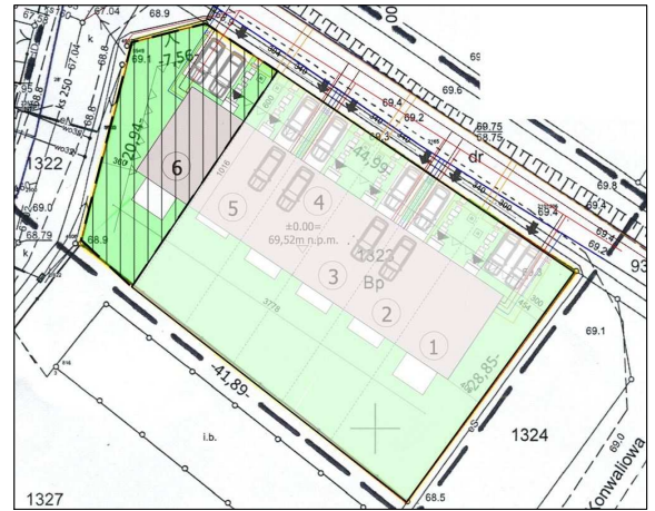
Budynek 6 - Kondygnacja 0