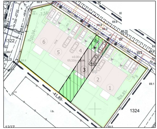
Budynek 3 - Kondygnacja 0