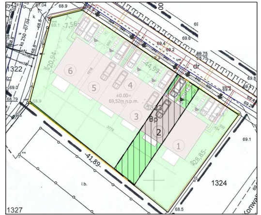
Budynek 2 - Kondygnacja 0